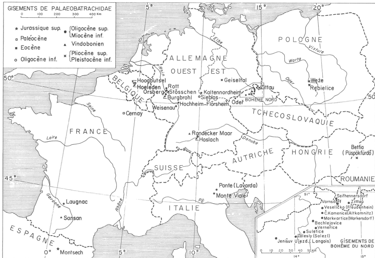
FIG. 2. — Répartition géographique et stratigraphique des Palaebatrachidae.